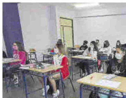
Una clase de segundo de la ESO.

►► La baja demanda del francés comienza a generar problemas en el ámbito educativo porque apenas hay alumnos que quieran estudiar este idioma y son cada vez menos las horas lectivas de los profesores. Pero también tiene sus efectos negativos en la economía, ya que las empresas buscan perfiles con dominio de esta lengua, aunque estos apenas existen en Aragón. Se trata de una nueva distorsión entre la oferta y la demanda, entre las necesidades y los recursos existentes que lastra un desarrollo equilibrado del mercado laboral en la comunidad. Francia se ha convertido en el