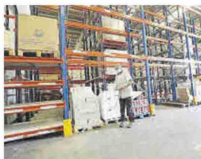
Aspecto del almacén de Zaragoza.

►► Por primera vez en su historia, el Banco de Alimentos de Aragón ha tenido que comprar comida con el dinero de las donaciones porque los almacenes cuentan con un 15% menos de mercancías (cuando lo normal es no caer), mientras que la demanda crece ante la subida de precios de los alimentos y de los recibos de la luz y el gas. La tasa de pobreza de Aragón (18,5%) es más baja que la nacional (26,4%), pero hay familias que están solicitando por primera vez esta ayuda. Por ello, los responsables de esta entidad piden no bajar la guardia. En Zaragoza falta sobre todo leche, cacao