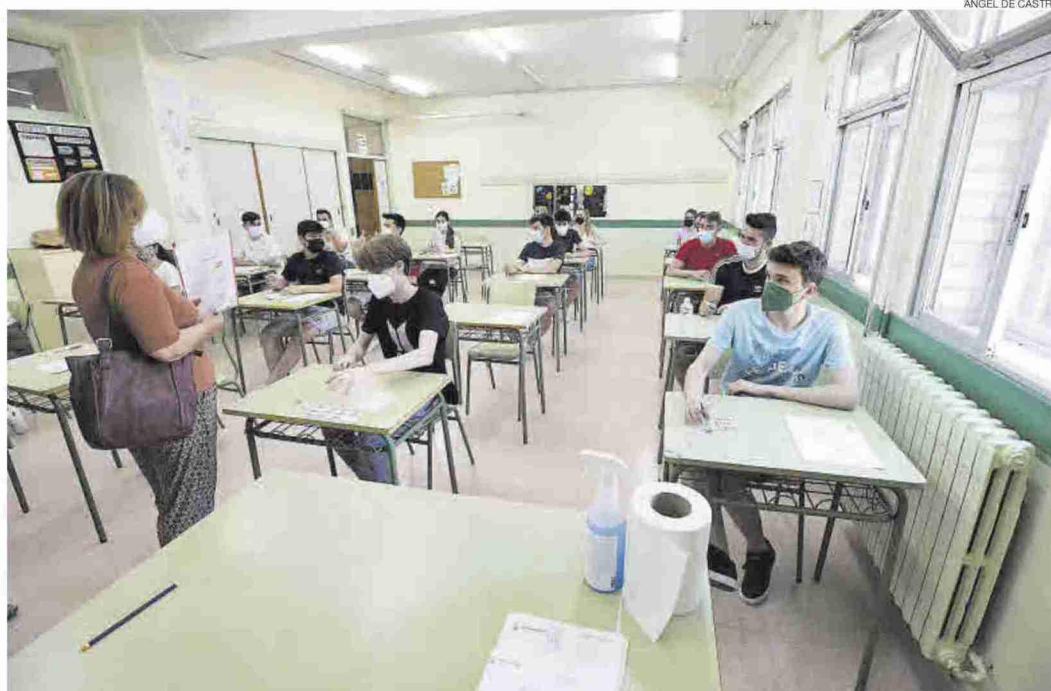
Varios alumnos en un instituto de Zaragoza, instantes antes de un examen de la Evau, en 2021.

Por esto mismo, desde el colectivo de docentes piden que el Francés pase a ser una asignatura obligatoria en toda la etapa educativa para, además, cumplir con el marco común de lenguas europeas que aboga por el plurilingüismo. «España y otros 11 países